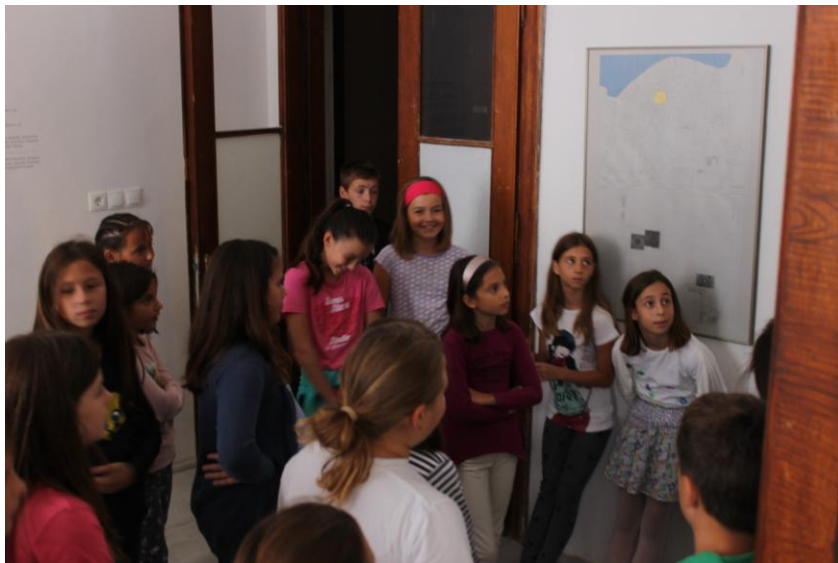
Sl. 24. Posjet školske djece Muzeju

Organiziran je izlet do arheološkog lokaliteta Purkin kuk s djecom iz osnovne škole.