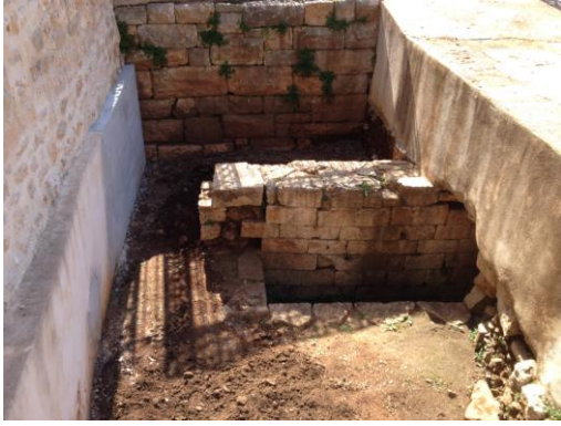
Sl. 2. Grčki bunar i prostor oko njega prije konzervatorsko-restauratorskih radova