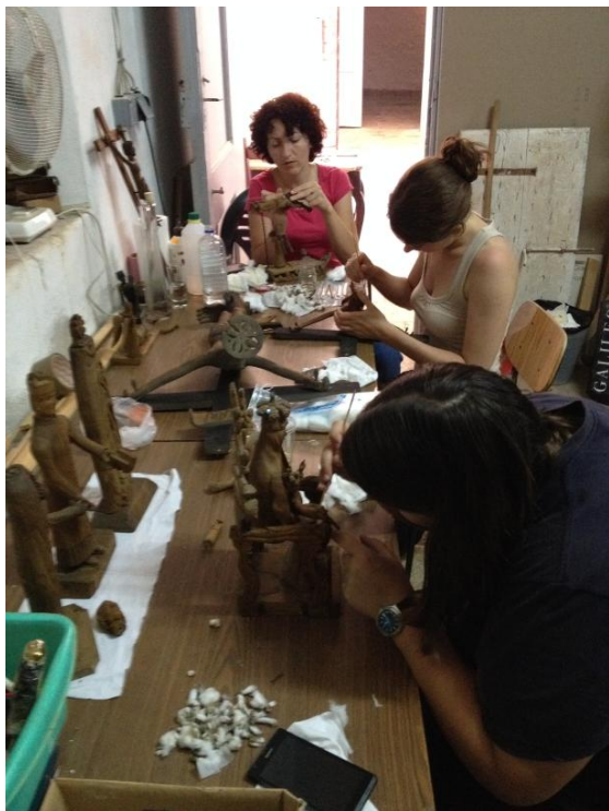
Sl. 8. Rad na skulpturama Josipa Makjanića

Izvršena je rekonstrukcija sitnijih dijelova najoštećenijih skulptura za izložbu „Josip Makjanić samouki kipar“ . Na figurama „Sv. Mihovil i Javal“ izvršeno je uklanjanje prijašnih intervencija, čišćenje, te ponovno spajanje i ljepljenje, a crna figura Javla minimalno je retuširana. Nekoliko figura spojeno je i zaljepljeno. S ostalih eksponata temeljito je uklanjena površinska nečistoća 10% otopinom sapuna Vulpex u vodi.