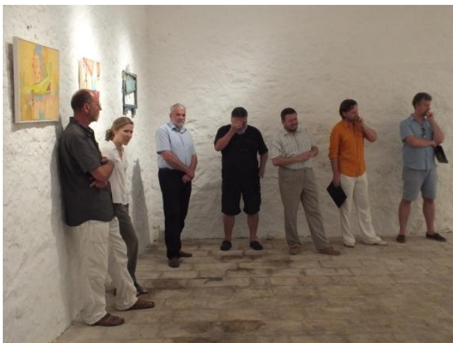
Sl. 14. Otvaranje izložbe Švaljek i Erdos