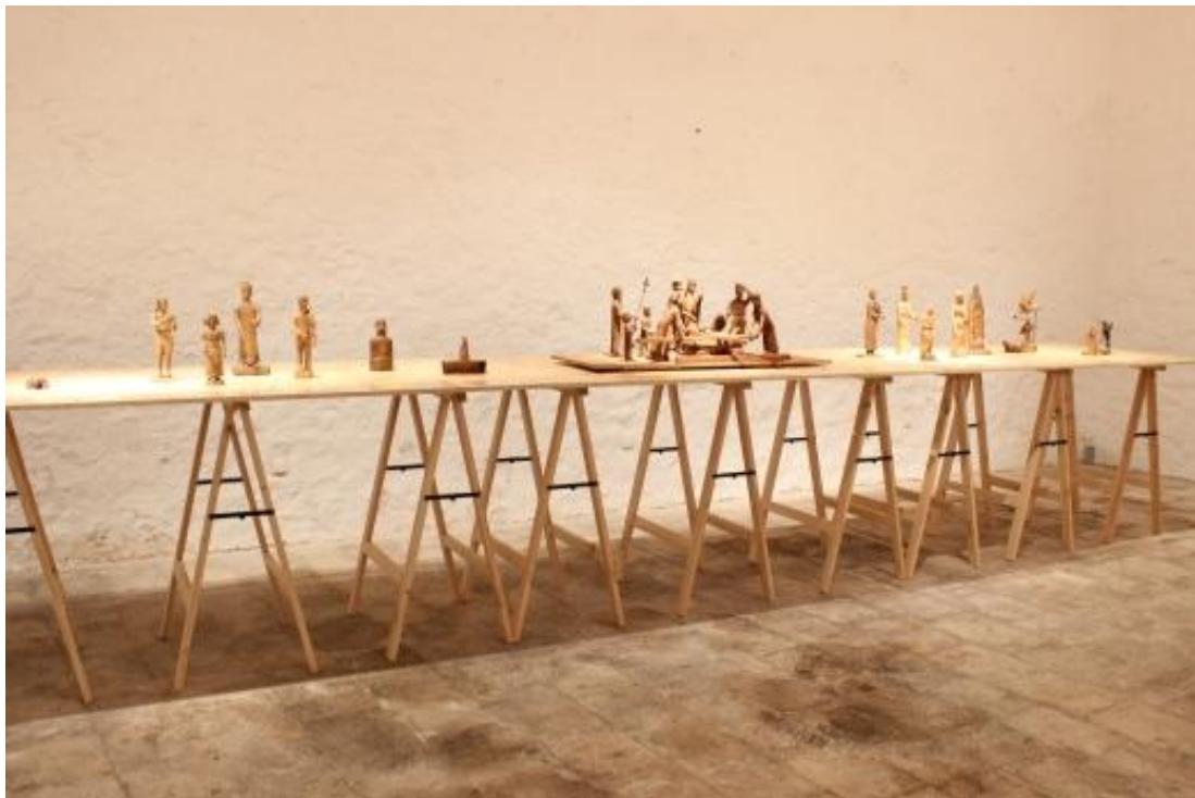
Sl. 19. Likovni postav izložbe Makjanić

Izložba je privukla veliki broj posjetitelja, kako otočana tako i turista.