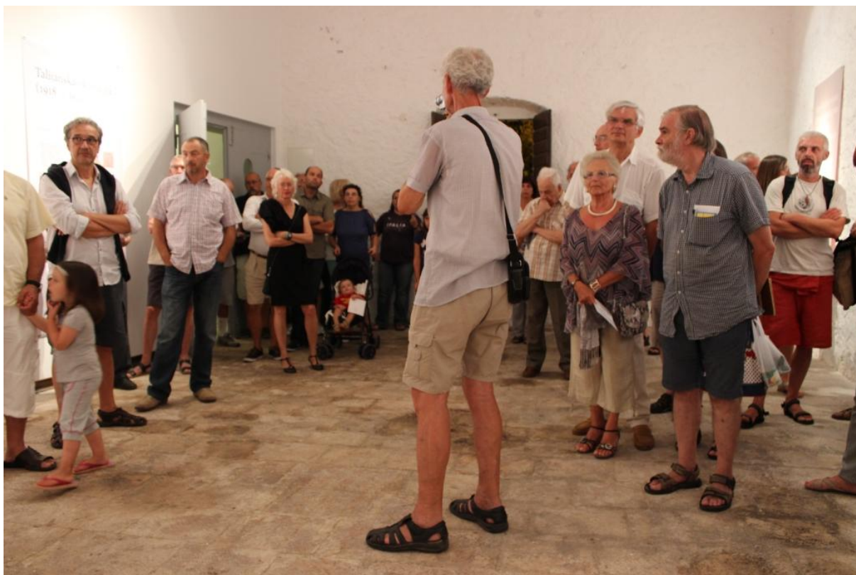
Sl. 22. S otvaranja izložbe