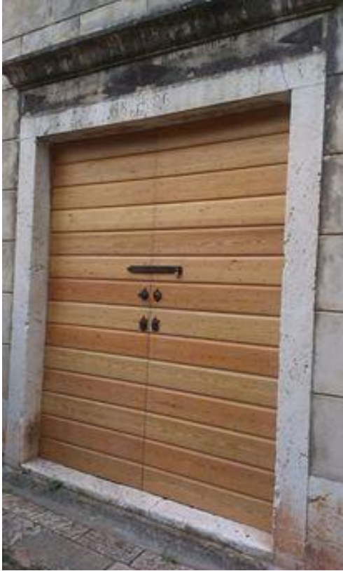
Sl. 26. Nova ulazna vrata u muzej