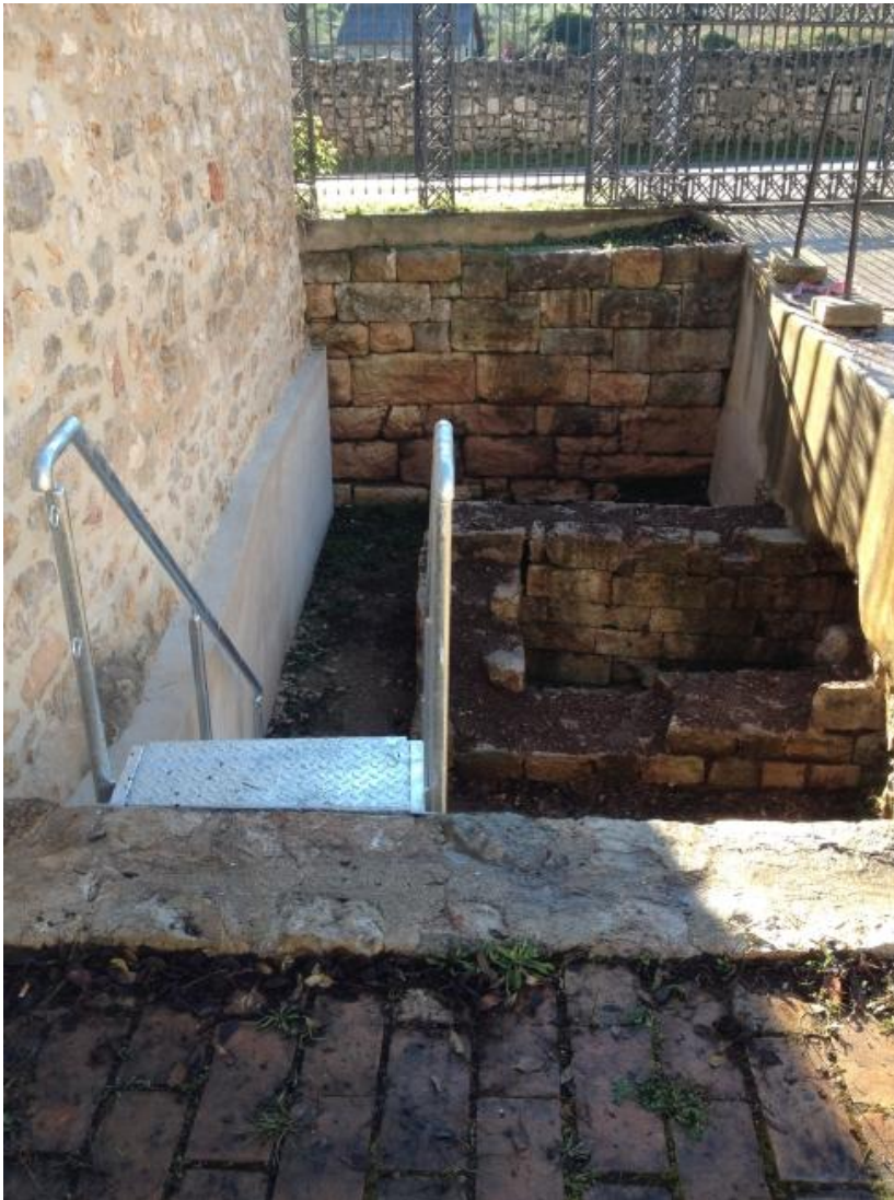
Slika 3. Isti prostor nakon konzervatorsko-restauratorskih radova