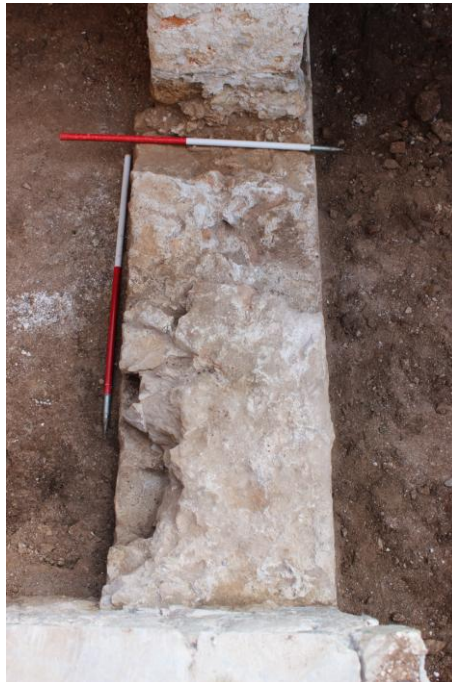
Sl. 6. Ostaci zida između stepeništa i zida prostorija A i B.

U pravcu južnog lica stepeništa otkriveni su ostaci zida dužine cca. 250 cm i širine cca. 70 cm. Ovi ostaci su zapravo nastavak južnog obrambenog zida Tvrđalja čiji se redovi vide i na južnom licu stepeništa. Osim toga, zid koji dijeli prostorije A i B djelomično je sagrađen na tom zidu. Kao što se može vidjeti i na južnom licu stepeništa, zid je građen od relativno pravilnih kamenih blokova, slaganih u pravilne redove.