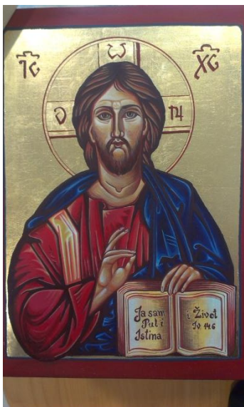
Sl. 11. Ikona izrađena na tečaju u Splitu

Vilma Stojković sudjelovala 5. i 6. prosinca na seminaru Muvi 05/2014 o izradi muzejskih filmova pod nazivom „Audiovizualna dokumentacija i prezentacija“ koji se održao u prostorijama MDC-a i Muzeju suvremene umjetnosti u Zagrebu.