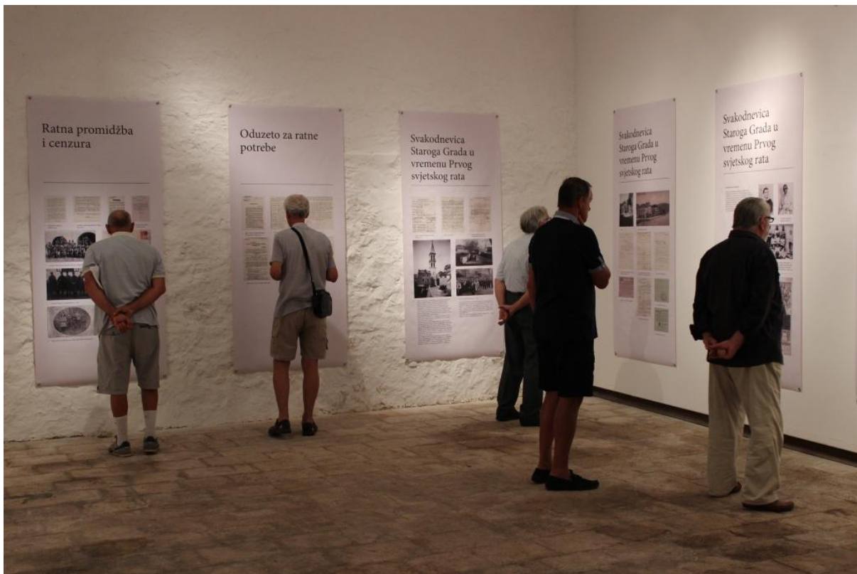
Sl. 21. Izložba o 1. svjetskom ratu