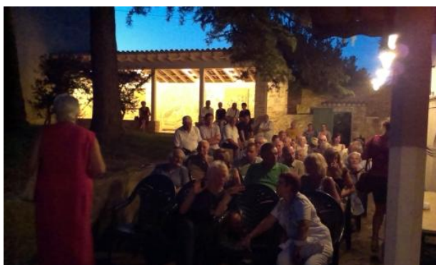
Sl. 25. Predstavljanje knjige Buchbergera u vrtu Muzeja

U vrtu muzeja predstavljena je knjiga Milovana Buchbergera „Ugledne osobe vezane uz Stari grad na otoku Hvaru“ 13. kolovoza.