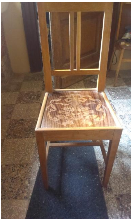
Sl. 9. Restaurirana secesijska stolica