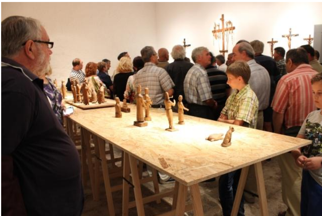
Sl. 20. Otvaranje izložbe Makjanić