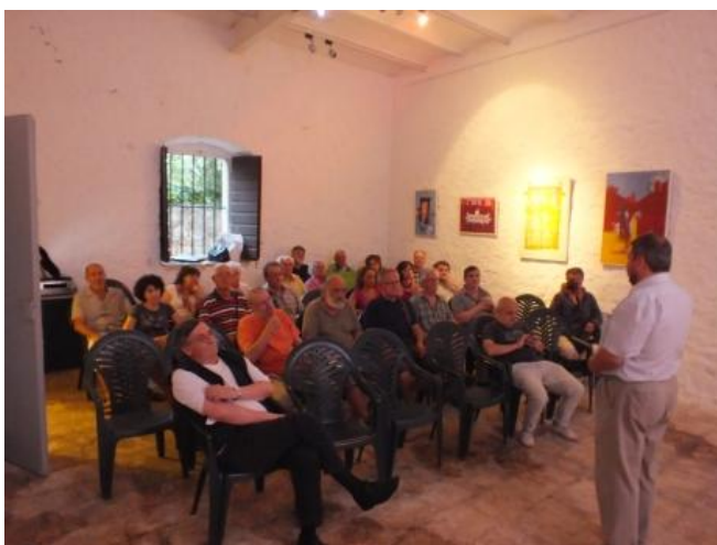
Sl. 16. S jednog od predavanja

Izložba pachworka u sklopu festivala „ Divlje cvijeće Europe “