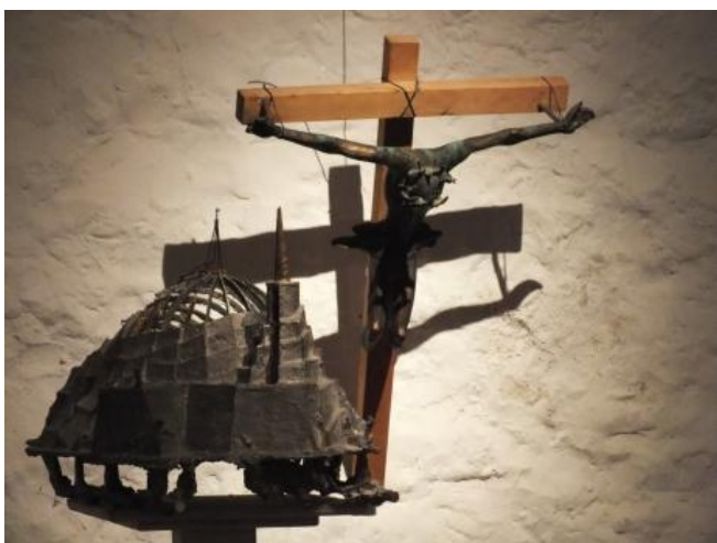
Sl. 15. Izložba Bachman