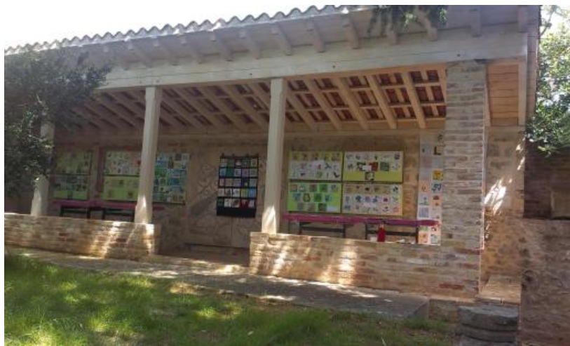
Sl. 17. Festival „Divlje cvijeće Europe“ u lapidariju Muzeja Staroga Grada

Umjetnička izložba fotografija Ive Pervana „ Etno vizure otoka Hvara “