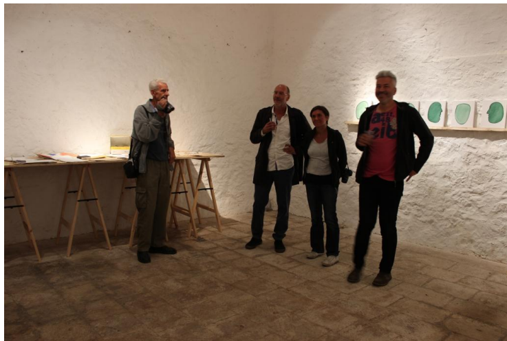
Sl. 23. S otvaranja izložbe Zimski period

Izložba je privukla veliki broj posjetitelja, a posebno je vrijedno što su je posjetili učenici starijih razreda osnovne škole u Starome Gradu.