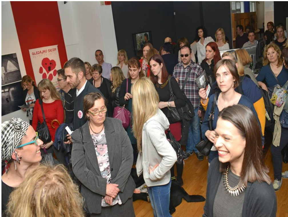
Slika 3. Posjetitelji na otvorenju izložbe „Psi anđeli“