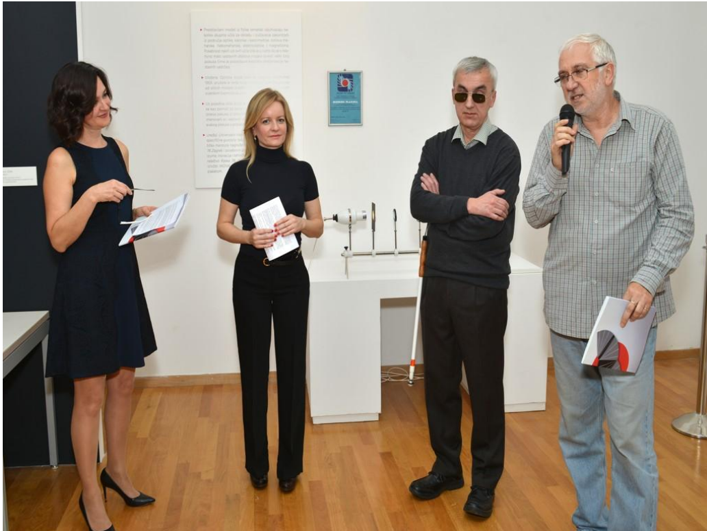
Slika 11. Otvorenje izložbe „Želim znati“