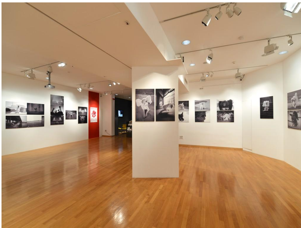
Slika 2. Dio postava izložbe „Psi anđeli“