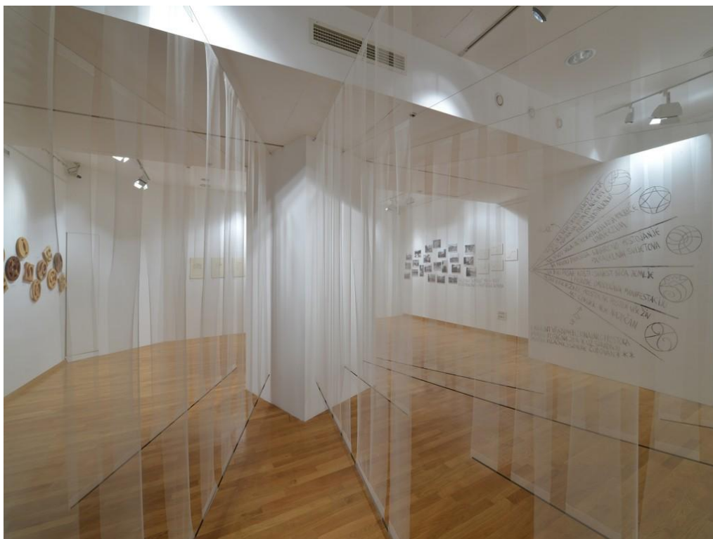
Slika 4. Dio postava izložbe „Labirint višedimenzionalnog prostora“