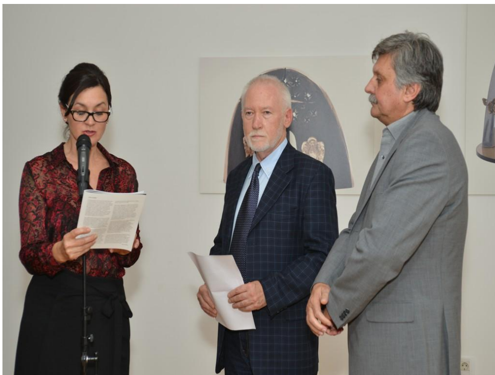
Slika 6. Otvorenje izložbe „Manje je više“