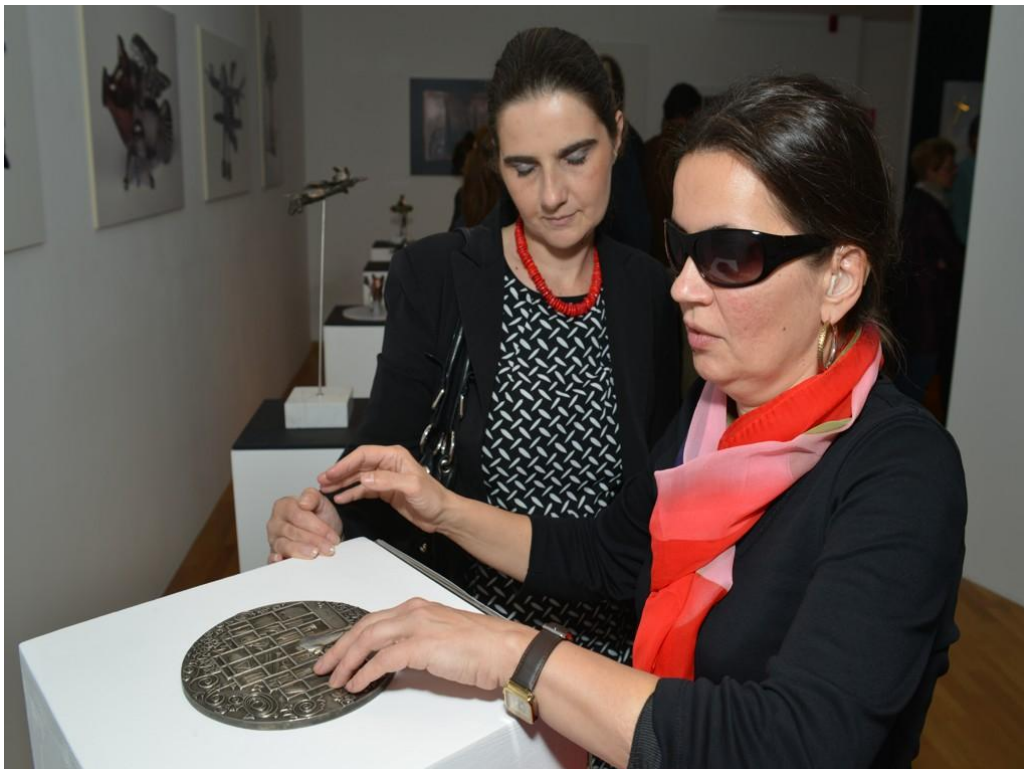
Slika 8. Gluhi slijepa posjetiteljica na izložbi „Manje je više“