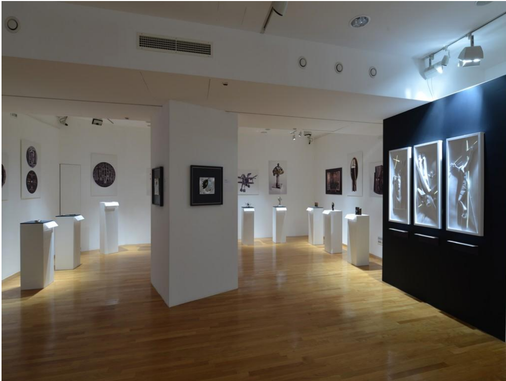
Slika 7. Dio postava izložbe „Manje je više“