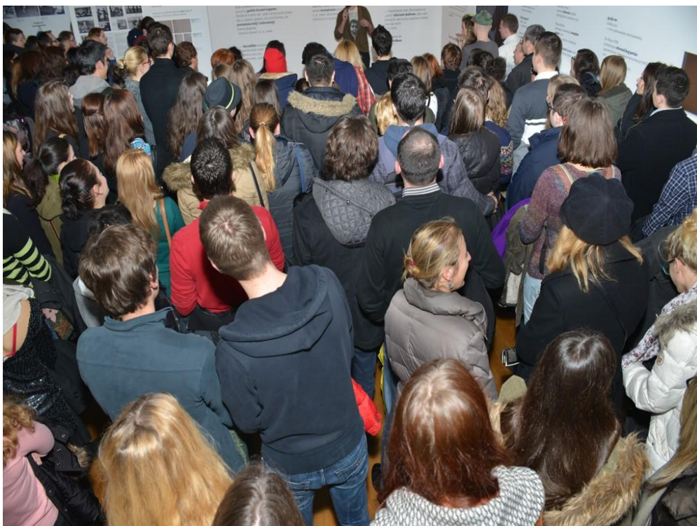
Slika 1. Noć muzeja 2014