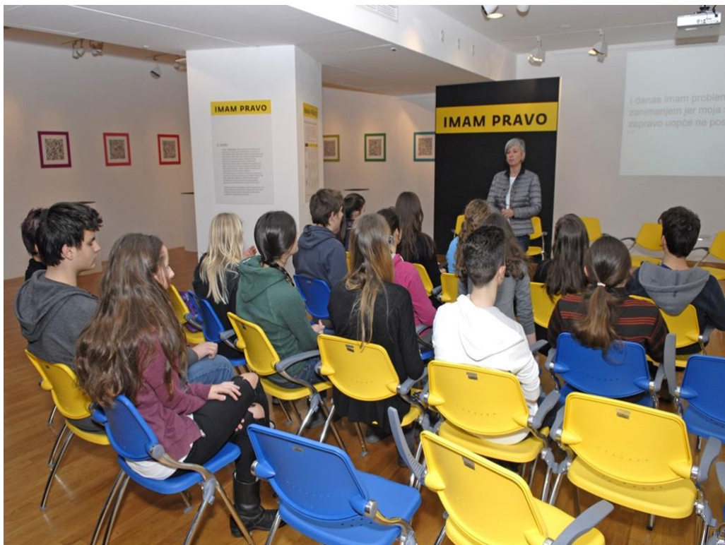
Slika 10. Predavanje u okviru izložbe „Imam pravo“