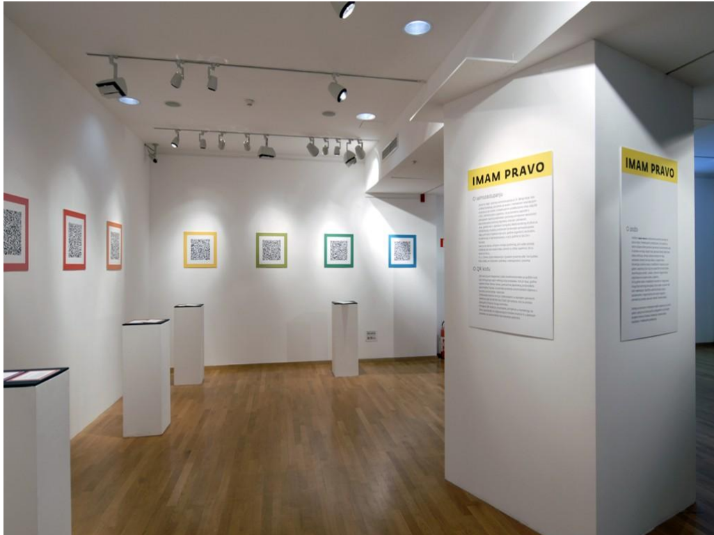
Slika 9. Dio postava izložbe „Imam pravo“