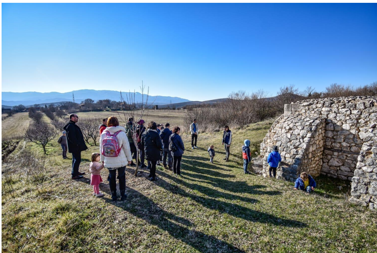
Slika 4. Akcija Upoznaj svoju zemlju