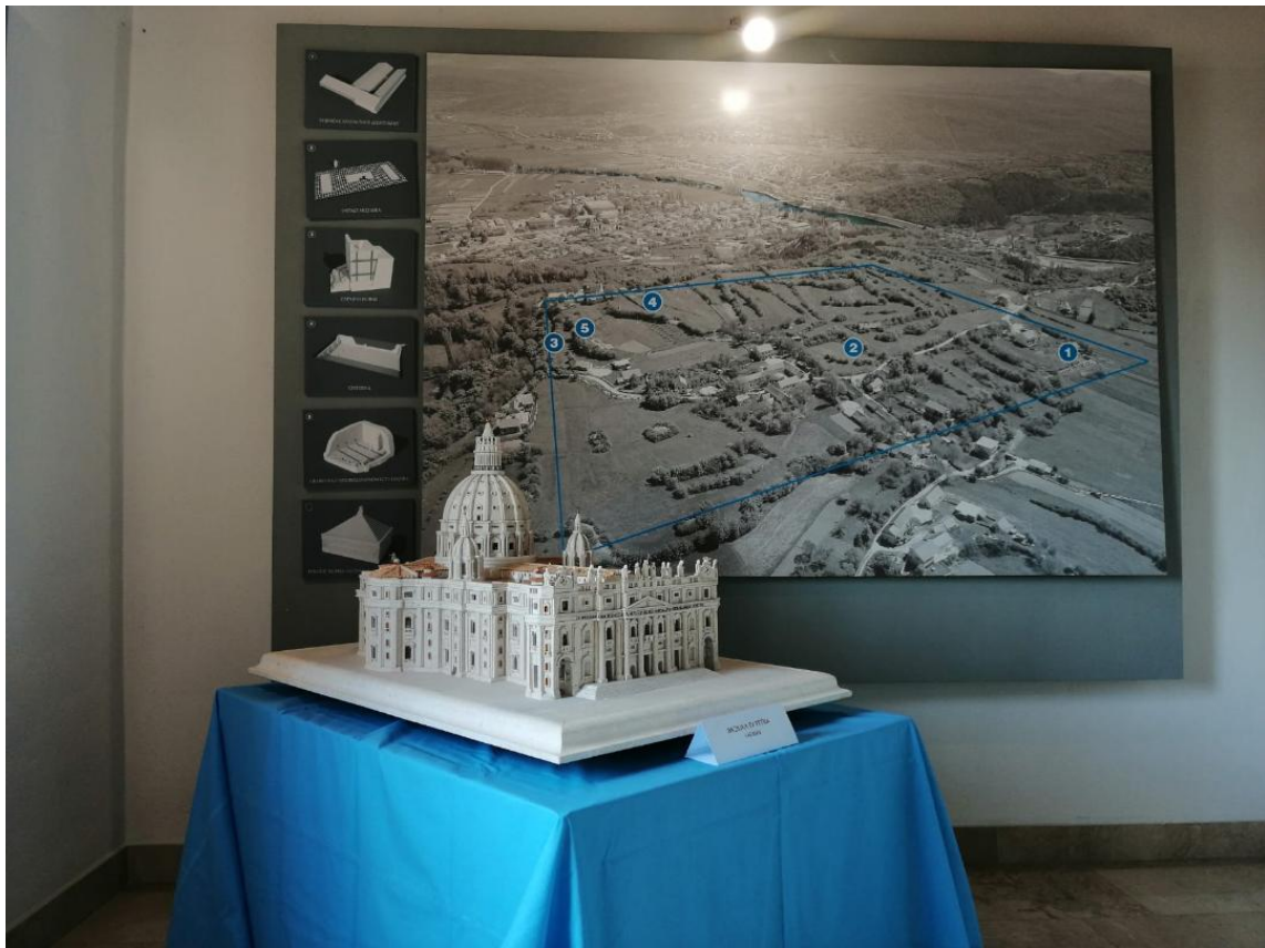
Slika 3. Isječak izložbe Makete