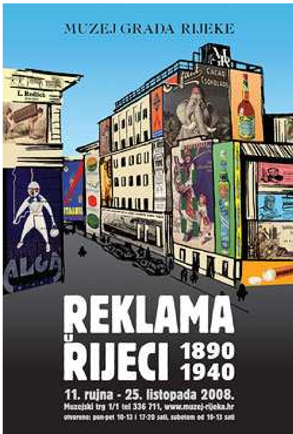
Plakat "Reklama u Rijeci", dizajn Klaudio Cetina, Muzej grada Rijeke