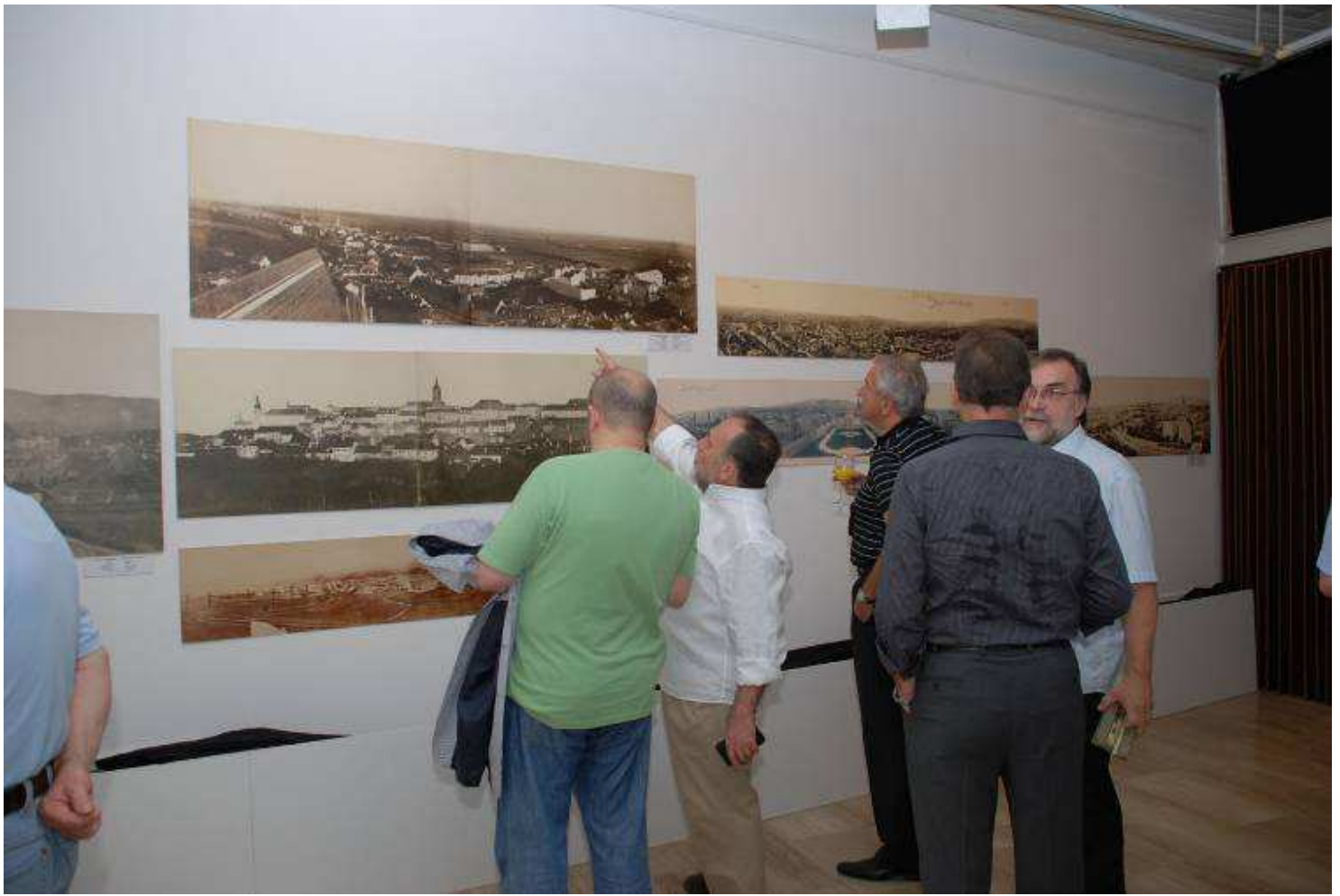
Gostovanje Muzeja grada Zagreba, na otvorenju