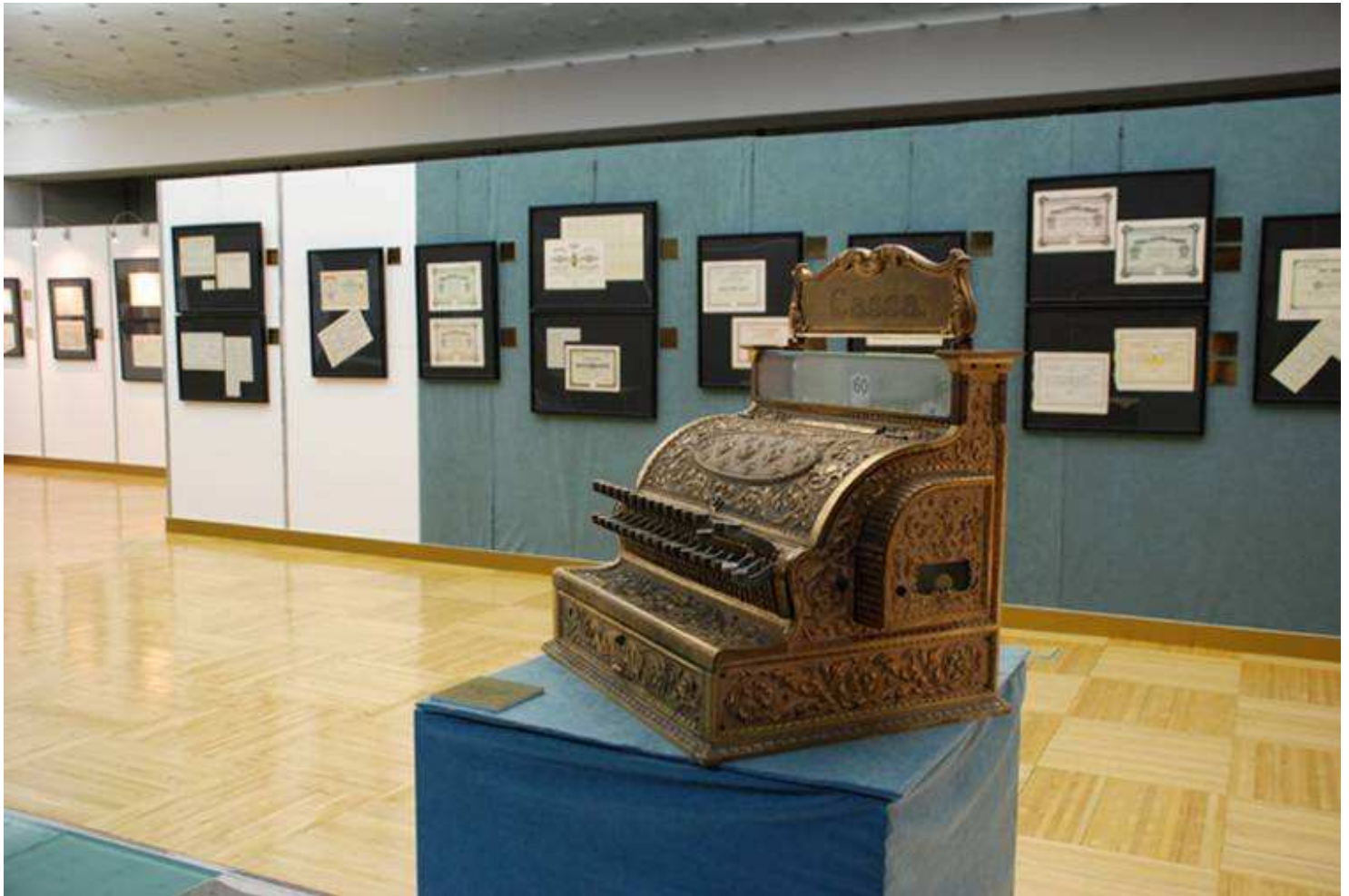
Povijesne vrijednosnice Rijeke i Sušaka iz fundusa