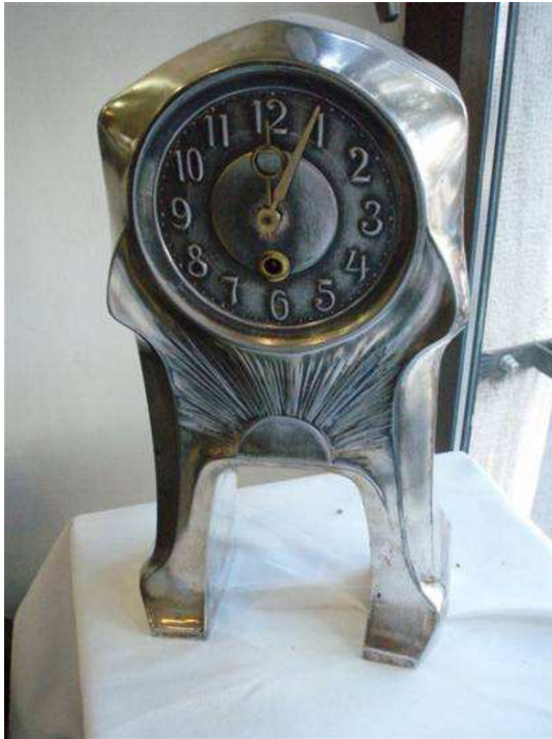
Secesijski sat, Njemačka, poč. 20. st., posebrena metalna legura