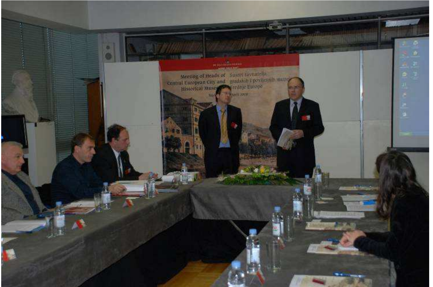
S "Prvog susreta ravnatelja gradskih i povijesnih muzeja Srednje Europe"