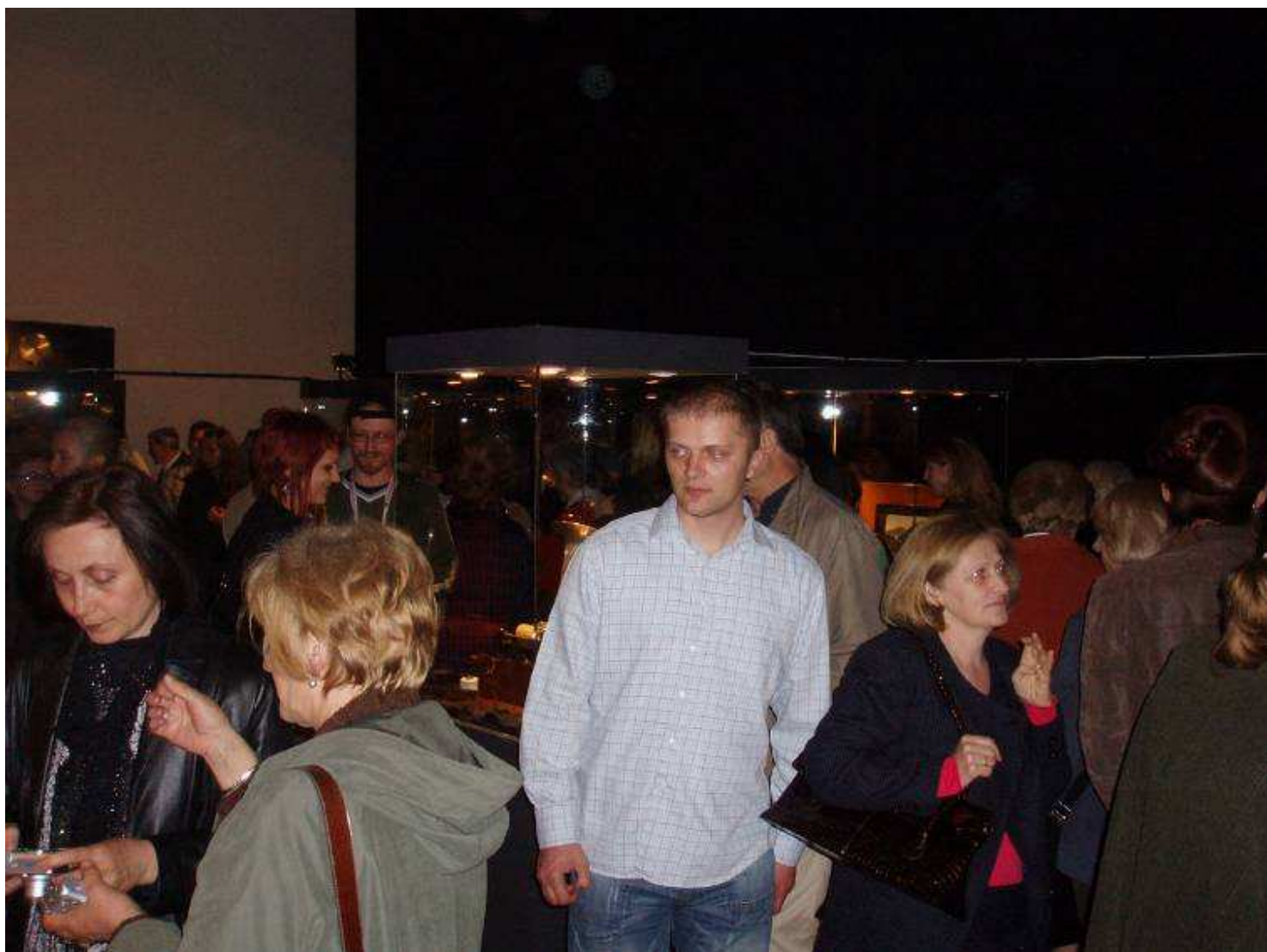
Izložba "Čarobna igla – ko nekad u osam" u Muzeju Vojvodine