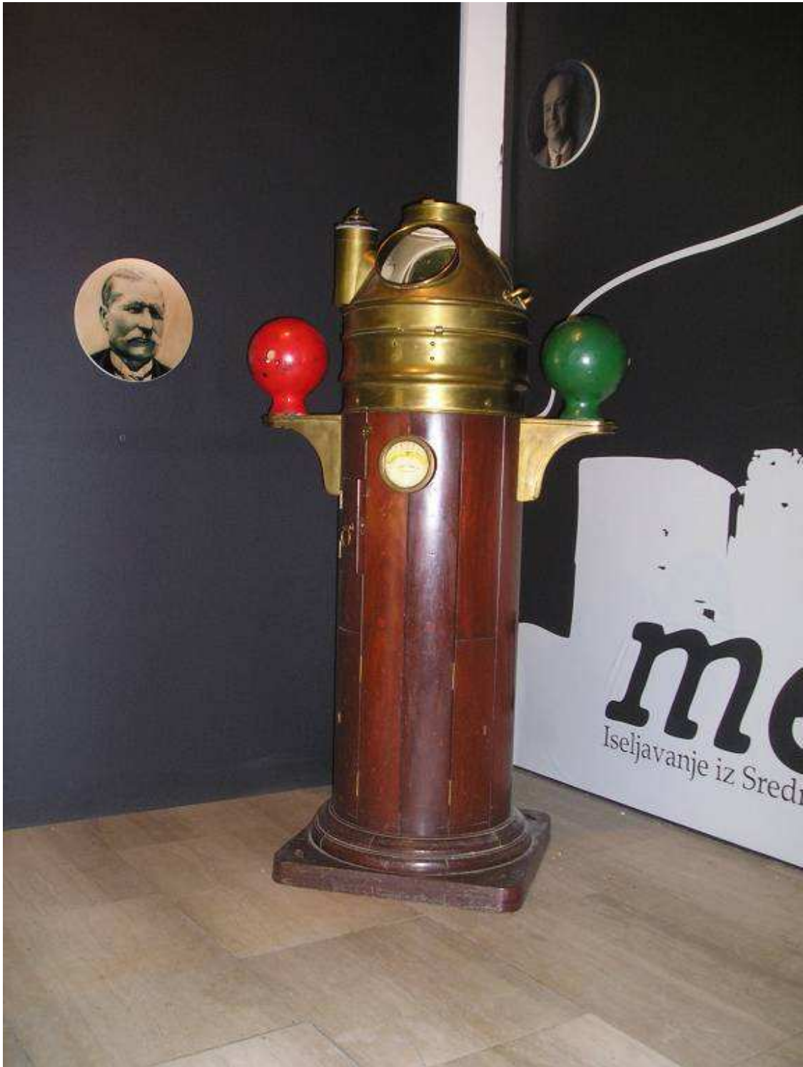
Brodski magnetski kompas sa tekućinom, tip "Sestrel"