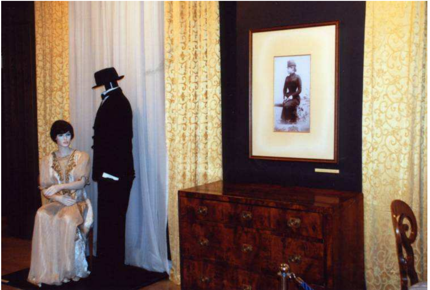
Gostovanje Muzeja Vojvodine, detalj s izložbe