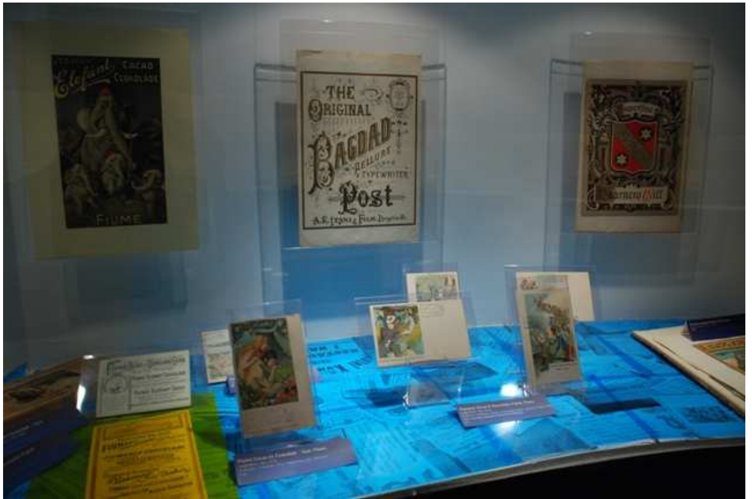
Detalj s izložbe "Reklama u Rijeci 1890.-1940."