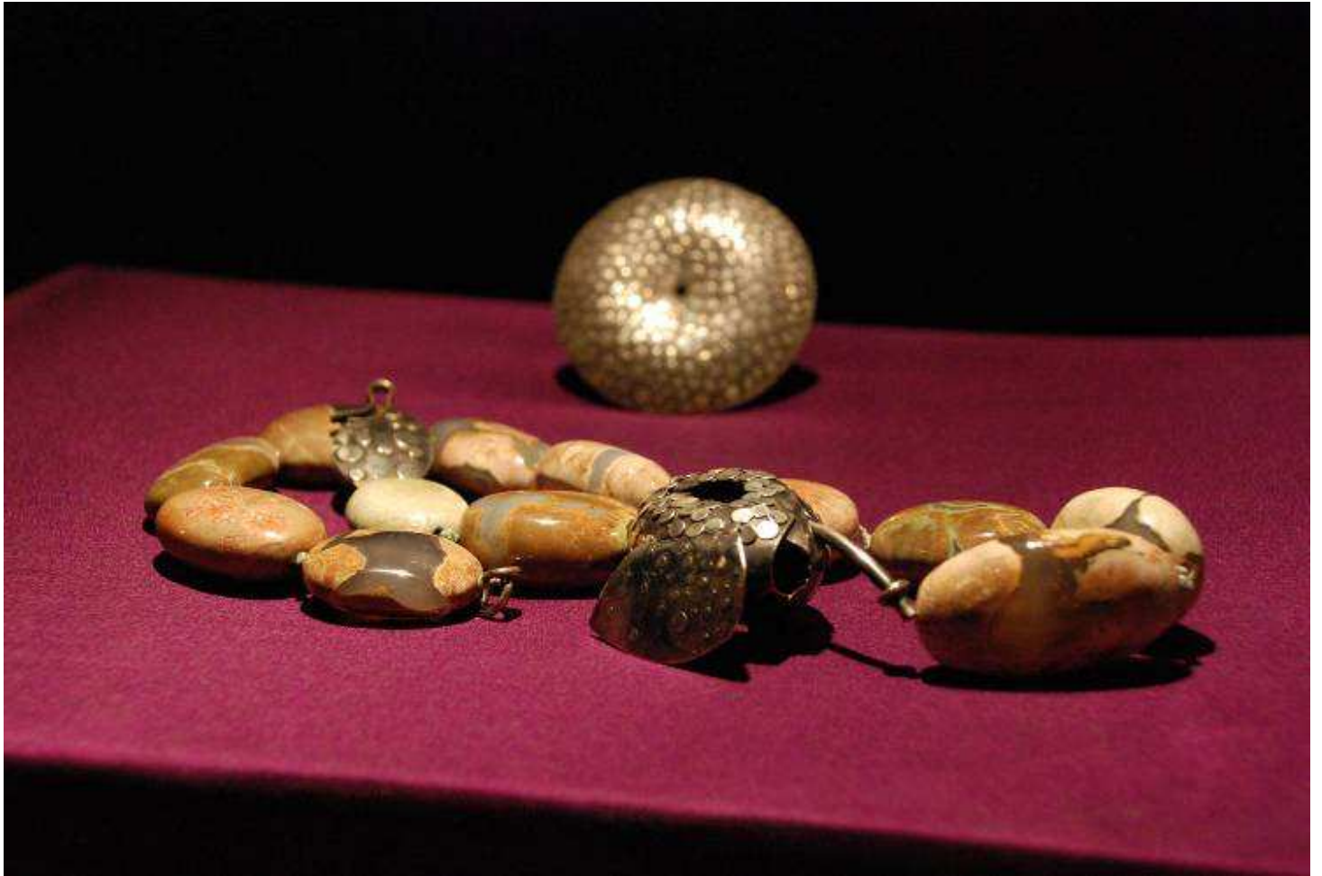
Detalj s izložbe "Lazer Lumezi"