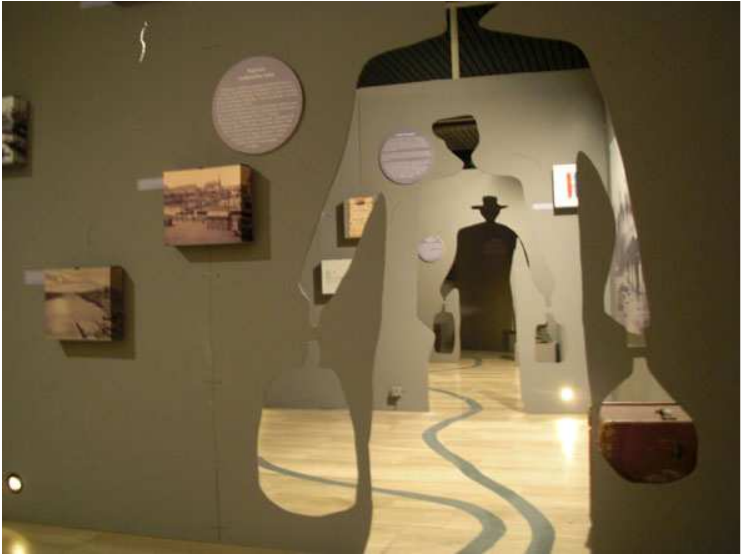
Dio postava izložbe "Merika"