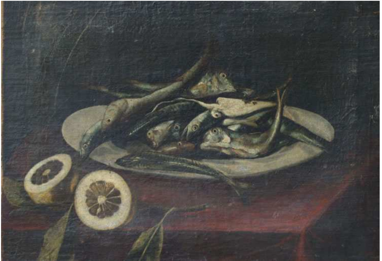
"Mrtva priroda s ribama i limunom" ulje na platnu, kraj 17. - početak 18. st., nakon restauracije