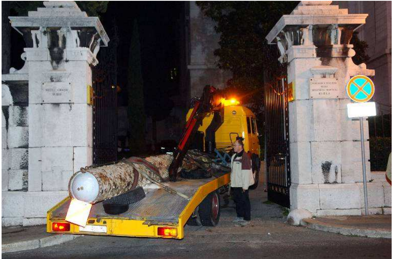
Doprema donacije iz Splita