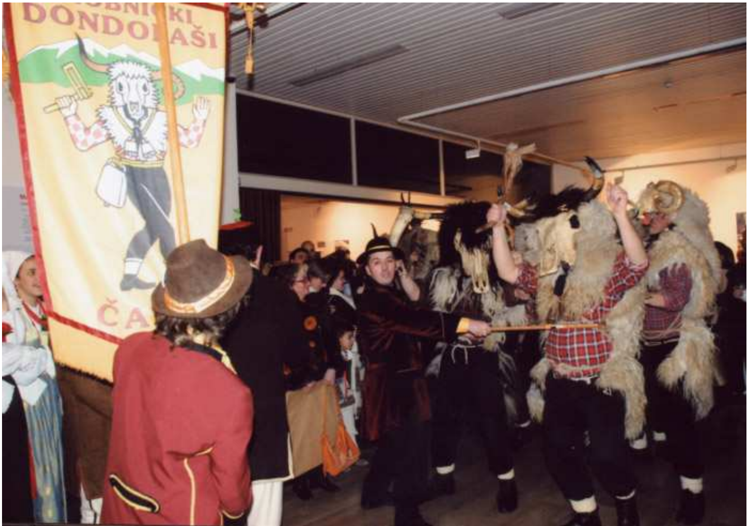
Gužva u Muzeju grada Rijeke – vesela i maškarana Noć muzeja 2008.