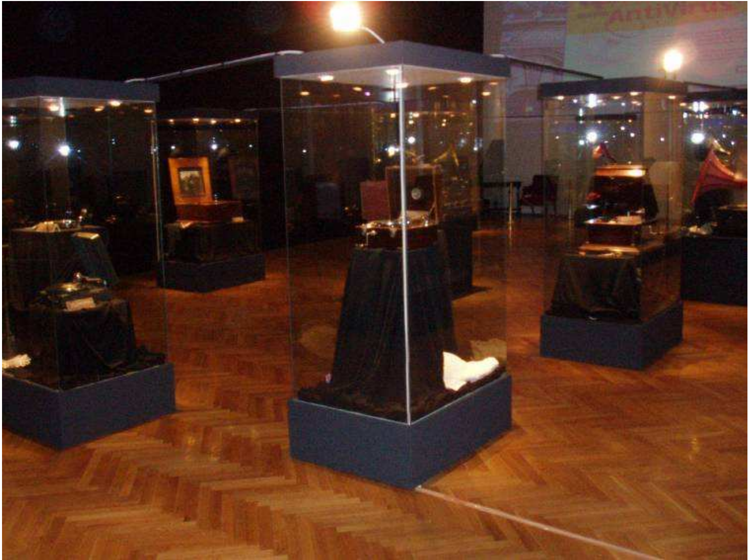
Izložba "Čarobna igla – ko nekad u osam" u Muzeju Vojvodine