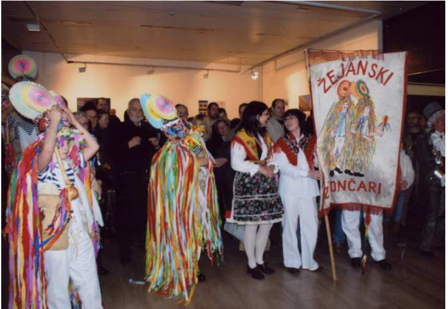
Noć muzeja 2008. u Muzeju grada Rijeke