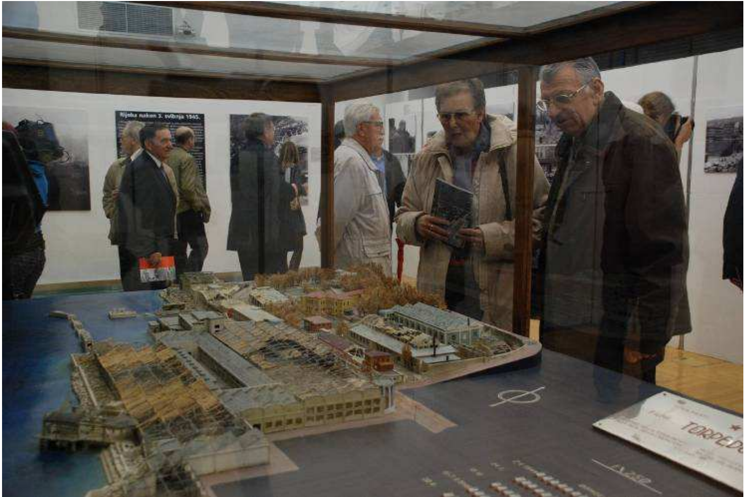
Na otvorenju izložbe "Rijeka nakon 3. svibnja"