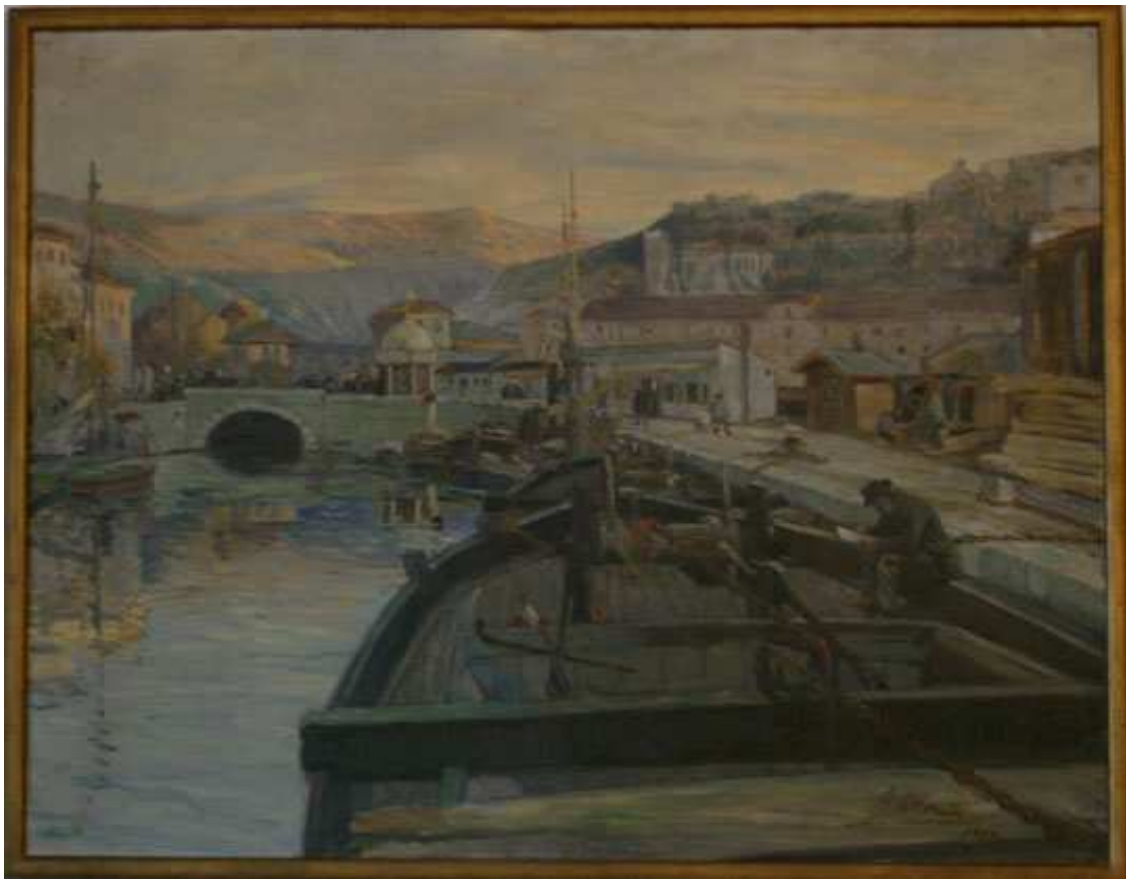
Josip Moretti Zajc, "Pogled na Trsat", 1913. ulje/platno