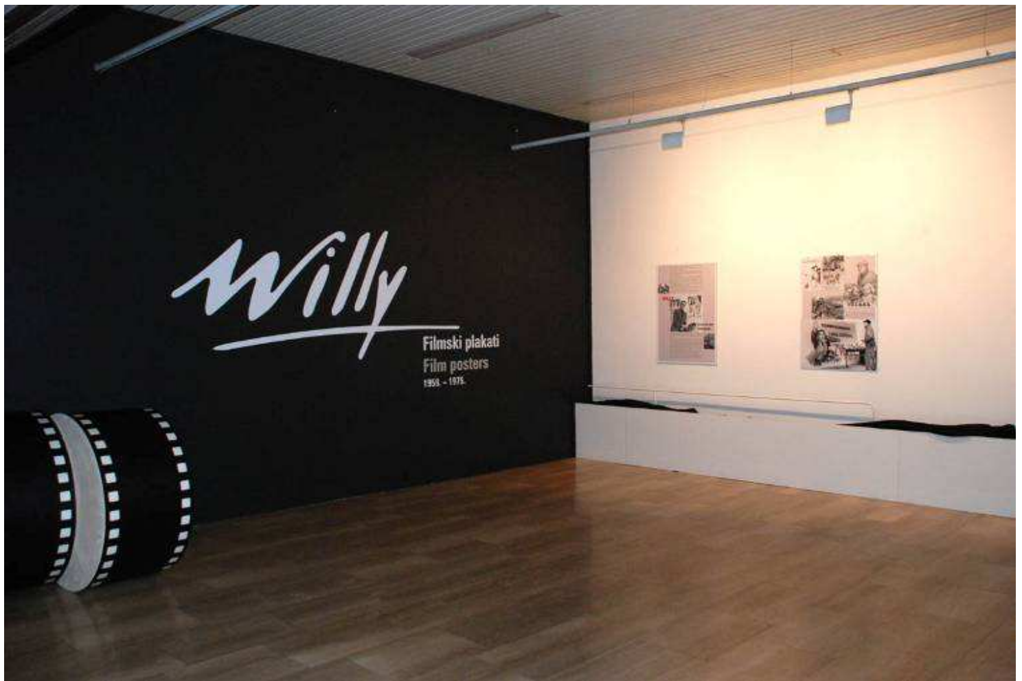
"Willy – Zlatne godine filmskog plakata" - detalj izložbe